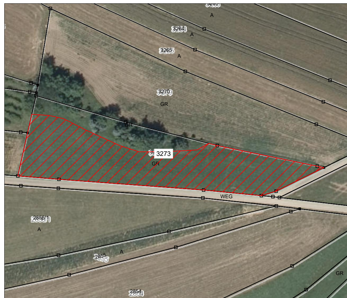
externe Ausgleichsfläche Flst. Nr. 3273, Gemarkung Adelhausen M 1:1.000